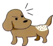
ノミの唾液によるアレルギー性皮膚炎