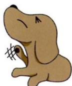
かゆみによるストレス